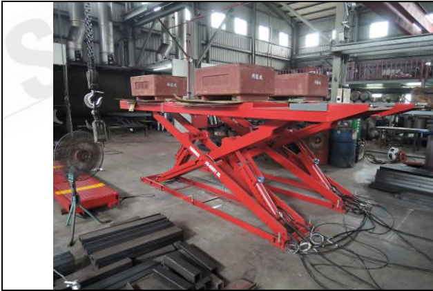
照片 “G” 荷重測試