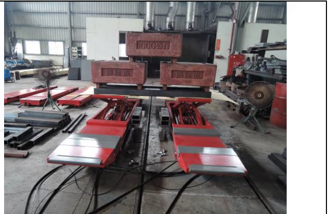
照片 “H” 荷重測試 - 3T