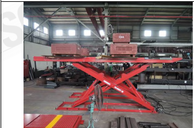
照片“E” 荷重測試 - 5T