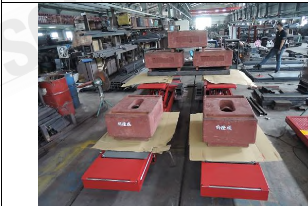
照片 “K” 荷重測試 - 3T