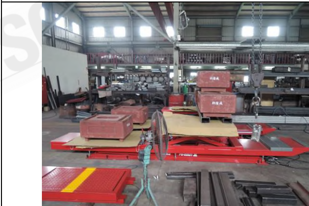
照片 “I” 荷重測試 - 3T