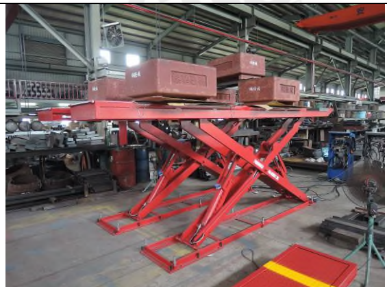
照片“F” 荷重測試 - 5T