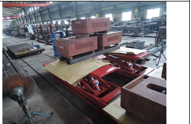
照片 “J” 荷重測試 - 3T