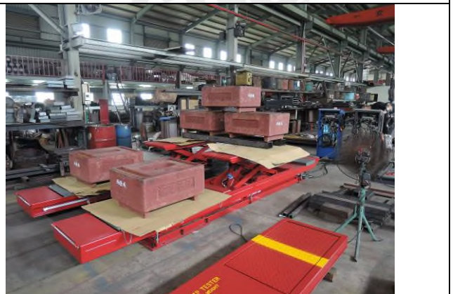
照片 “L” 荷重測試 - 3T