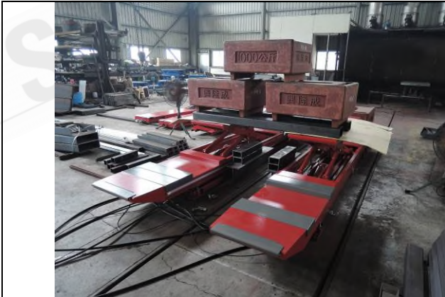
照片 “G” 荷重測試 - 3T