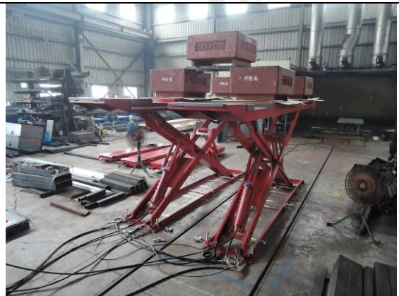
照片“D” 荷重測試 - 5T